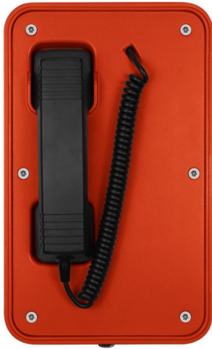
Teléfono resistente a la intemperie