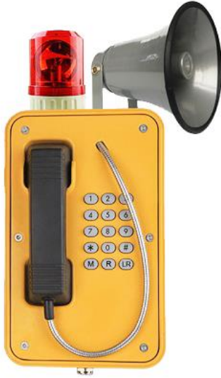
Teléfono resistente a la intemperie